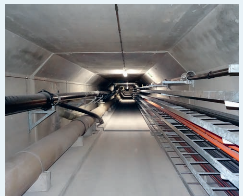
Ein durchdachtes Kabelmanagement ist besonders im Zeitalter der Digitalisierung unerlässlich.