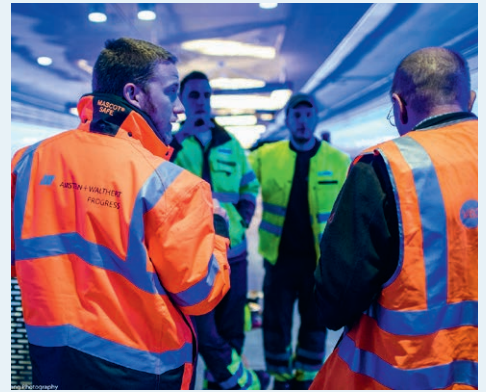
Präsenz vor Ort ist entscheidend für erfolgreiche Bauleitung und aussagekräftige Inspektionen.